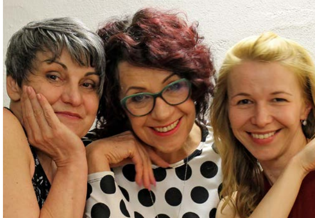
H. Nemravová, O. Strašáková, R. Mrázová